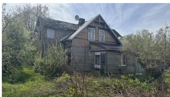
Dzīvojamā ēka lit.003