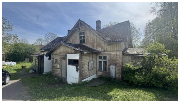
Dzīvojamā māja lit.001