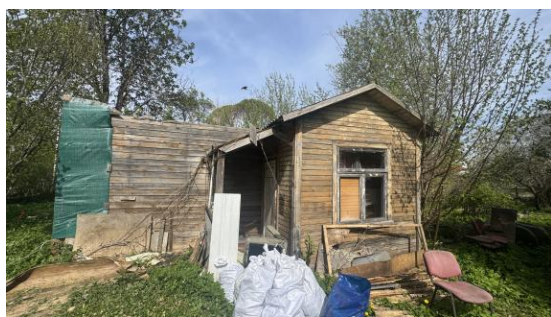
Dzīvojamā ēka lit.002